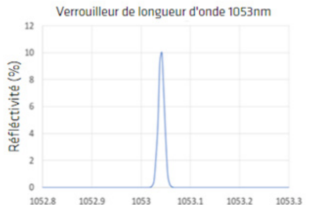
Figure 3: Spectre de transmission typique du WVL

Par exemple, la série WaveLock de verrouilleurs de longueur d'onde d'indie offre d'excellentes performances en termes de précision de la longueur d'onde, de largeur de bande, de rapport de suppression des modes latéraux et de pertes d'insertion. Un spectre de transmission typique d'un FBG WVL d'indie est illustré dans la figure 3 ci-dessous.