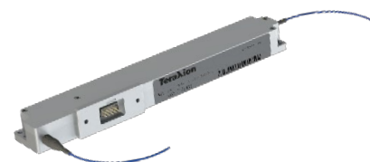
Transmission + Reflection (T+R) compact module

Contactez-nous à info@teraxion.com ou visitez notre site web www.indie.inc/photronics .