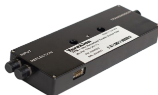
Transmission + Reflection (T+R) standard module