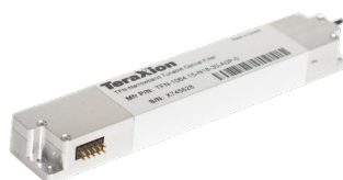
Reflection (R) module